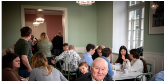
90 urodziny siostry Liji oraz pierwsza kawa po nabożeństwie na plebanii