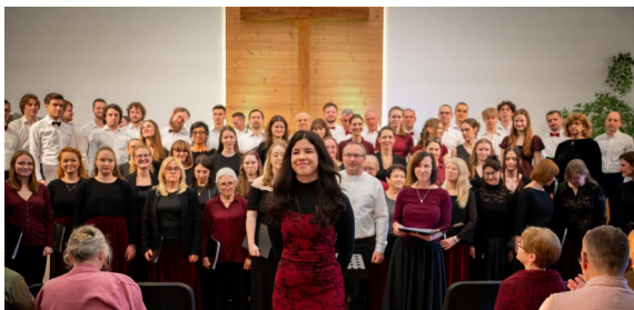
Koncert finałowy po warsztatach chóralnych, niedzielną wieczór 8 marca 2026