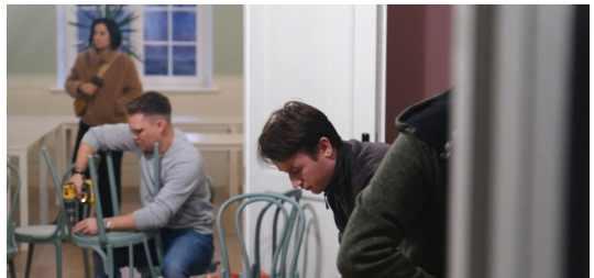
Wyłożone prace porządkowe w przeddzień otwarcia zborowej kawiarenki, 27 marca 2026

W sobotę 28 marca, już w nowych przestrzeniach, odbyła się niespodziankowa imprezka urodzinowa dla seniorki