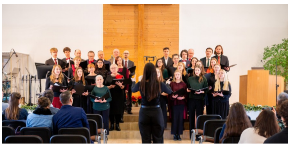
Usługa chóru podczas niedzielnego nabożeństwa, 4 stycznia 2026

W niedzielę 4 stycznia mieliśmy możliwość wysłuchać trzech pieśni przygotowanych przez zborowy chór. Były one treściowo związane z niedawnymi świętami Narodzenia Pańskiego. Wdzięczni jesteśmy