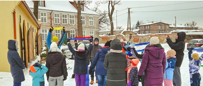
Podczas zimowiska „Stworzeni by wielbić” dzieci miały okazję cieszyć się urokami prawdziwej zimy!