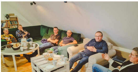
Spotkanie Rady Starszych na poddaszu dworu, wtorek 6 stycznia 2026

Jednym z nich może być regularne trwanie w lekturze Pisma Świętego. Wielu z nas czyta Słowo Boże korzystając z różnych planów. W związku z tym od 1 stycznia rozpoczynamy lekturę Biblii na nowo. Na zborowym kanale w serwisach YouTube i Spotify udostępniamy codzienne porcje Słowa w oparciu o Chronologiczny Plan Czytania. W tym roku przygotowaliśmy również zestaw zakładek do Biblii, które są pomocne aby trzymać się tego planu.